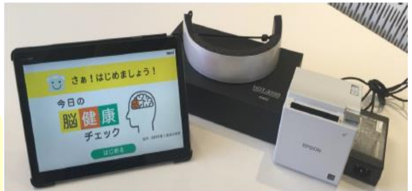
タブレット (10インチ)

■TMT (Trail Making Task) と呼ばれるベーシックな認知機能評価タスクを行い、そのスコアおよび脳血流の増加量で、脳の健康をチェックします。 約3分で計測できる お手軽セルフチェック機器です。